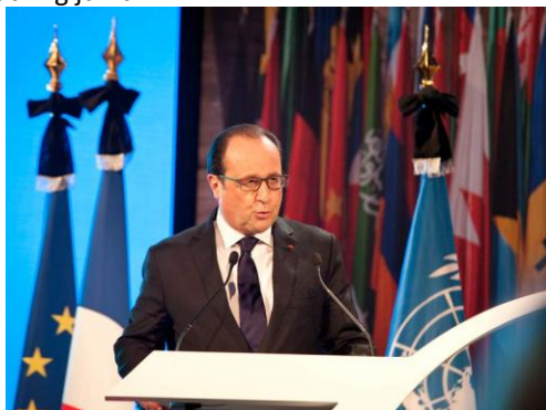
François Hollande kõneles UNESCO juubelifoorumil