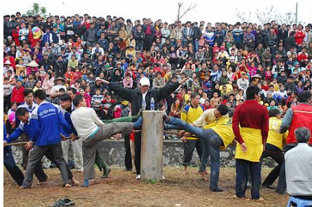
Vietnam, Kambodža, Filipiinid ja Korea Vabariik esitasid esindusnimekirja köieveo traditsiooni