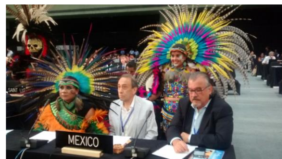
Mehhiko värvikas delegatsioon istungil