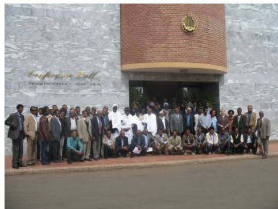
Eritrea konsultatsioonikohtumisest osavõtjad.

8.-10. aprillil osales Kristin Kuutma UNESCO poolt kutsutud eksperdina konsultatsioonikohtumisel Eritreas, et tutvustada VKP kaitse konventsiooni põhimõtteid ning jagada Eesti kogemust konventsiooni rakendamisel. Osalejate seas oli nii Eritrea ministeeriumide, ülikoolide, muuseumide, uurimisasutuste ja kohalike omavalitsuste esindajaid kui ka kohaliku pärimuskultuuri kandjaid. Eelmise aasta märtsis tutvustas Kristin Kuutma Lõuna-Aafrika Vabariigis toimunud 12 Aafrika riigi kohtumisel rahvuslike vaimse kultuuripärandi nimistute koostamise nõuet VKP kaitse konventsiooni kontekstis ja Eesti vastavat kogemust.