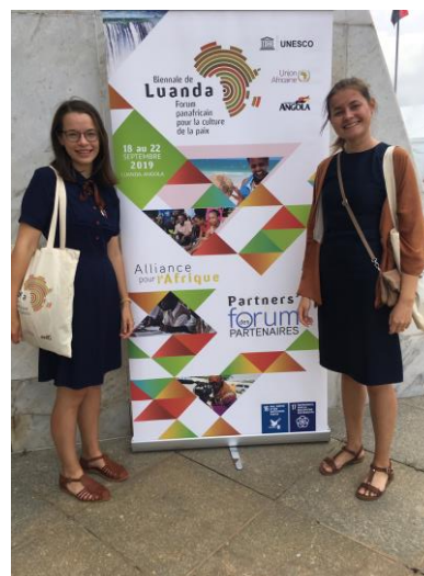
Eesti esindajad biennaalil

18.–22. septembril toimus Angolas Luanda biennaal, mida korraldasid UNESCO, Aafrika Liit ja Angola valitsus. Biennaalil oli kolm suuremat osa: UNESCO partnerite foorum ja UNESCO juhitud paralleelsessioonid, ideedefoorum ja noortefoorum. Ideedefoorumi raames toimus eraldi naiste temaatikale pühendatud päev, paralleelselt foorumiga tutvustati kultuurfestivali raames Aafrika eri piirkondade kultuuri. Tegemist oli Aafrika-ülese sündmusega, kus osalesid Aafrika riigid ning UNESCO ja Aafrika Liiduga seotud osapooled avalikust, era- ja kolmandast sektorist, samuti UNESCO eri programmide eksperdid ning Aafrikas tegevad riigid mujal maailmast.