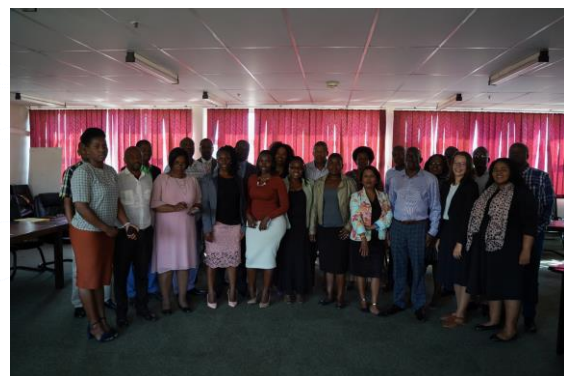
eSwatini UNESCO ühendkoolide õpetajad koolituspäeval

UNESCO ERK panustab eSwatini komisjoni haridustegevustesse WIFI võimaldamisega igapäevatööks ning koolitustel osalejate transpordi ja toitlustuse toetamisega.