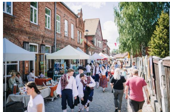
Viljandi hansapäevad.