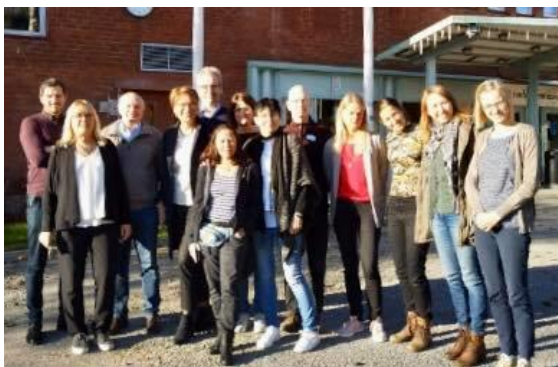
BSP koordinaatorite kohtumine Stockholmis.

Palju räägiti ka eTwinningu kasutamisest koolide omavahelises suhtlemises ning võrgutsikutöö edendamiseks. Soome koordinaatorid püüavad luua korralisi veebiseminare õpetajatele mitmesuguste teemade uurimiseks ja tundide ettevalmistamiseks.