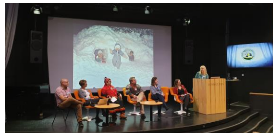
Vaimse pärandi konverents Soomes.

31. oktoobrist 2. novembrini toimus Espoos Hanaholmeni kultuurikeskuses rahvusvaheline vaimse kultuuripärandi konverents „Elav pärand Põhjamaades – kogukondade roll ja võimalused kestliku ühiskonna kujundamisel.“