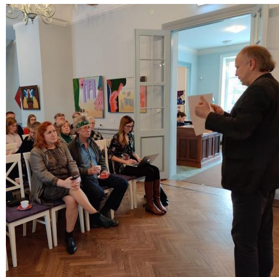
MAB strateegia kohtumine Hiiumaal.

Kaasamiskoosolekuid korraldasid Eesti MAB programmi eestvedajad ja eksperdid Toomas Kokovkin ja Lia Rosenberg, arutelu modereeris Toomas Kokovkin.