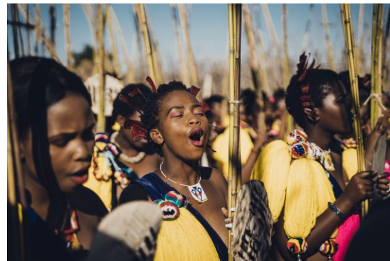
Umhlanga tseremoonia eSwatinis.

Lisaks viis Laura läbi jätkukoolituse külalstatud UNESCO ühendkoolide õpetajatele. Töötuba oli üles ehitatud grupitöö ülesannetel, mille kaudu õpetajad omandasid praktilisi oskusi edendamaks koolides kestlikku arengut toetavat haridust ja maailmakodanikuharidust. Kümnest külalstatud eSwatini UNESCO ühendkoolist alustasid viis kooli suhteid Eesti koolidega.