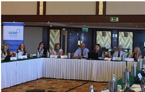
GENE uuringu protsessi tutvustamine Maltal.

väljakutsetele ja murekohtadele. Samuti tutvustati ja jagati muljeid ja arvamusi GENE sekretariaadi, Eesti võõrustajate ja rahvusvahelise töörühma perspektiividelt Eestis korraldatud GENE maailmahariduse uuringu protsessi teemadel. Uuringu avalikustamine Eestis on plaanis veebruari alguses.