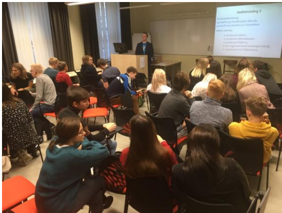
Filosoofiapäeva töötuba.