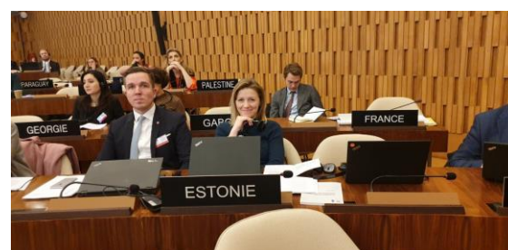
Eesti esindajad komitees.

Eesti teeb aasta lõpuks Kultuuriministeeriumi vahenditest vabatahtliku sissemaksena Haagi konventsiooni fondi summas 15 000 eurot.