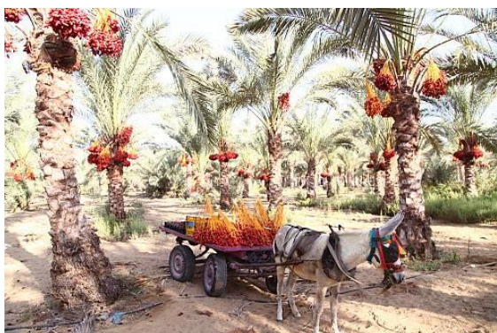
Datlite kogumine Palestiinas.