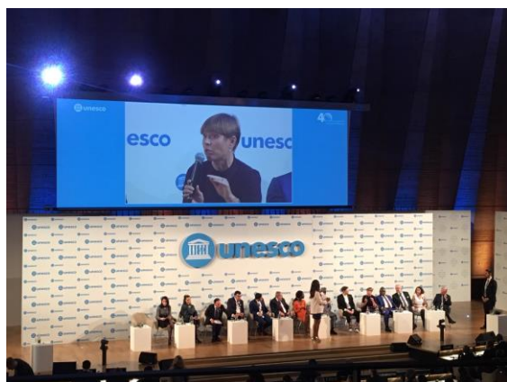
President Kersti Kaljulaid UNESCO peakonverentsi avaüritusel.

12.–27. novembril toimus Pariisis UNESCO 40. peakonverents. Peakonverentsil osales president Kersti Kaljulaid, kes pidas Eesti riigikõne ja arutas avaüritusel riigipeade ja noortega multilateralismi ja digiarengute teemadel.