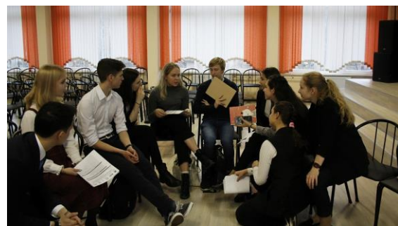
Õpilaste arutelu konverentsil.

õpilaste teaduskonverents, mis keskendus keskkonnahariduse ja kehtliku arengu alaste projektide rakendamisele koolides. Konverentsil esinesid õpetajad ja õpilased, teadlased, UNESCO Läänemere Projekti rahvusvaheline koordinaator Aira Unden-Selander, Eesti UNESCO ühendkoolide koordinaator Viktoria Rudenko jt.