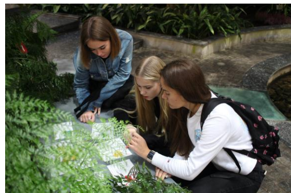
ÜRO matke seminar botaanikaaias.