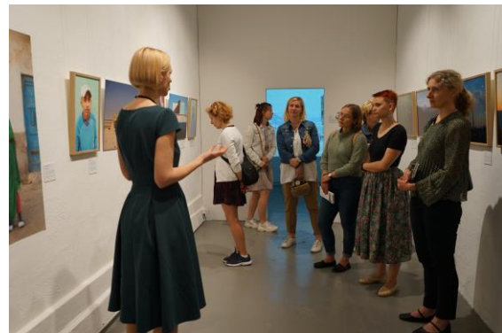
Maailmahariduse kursusel osalejad näitusega tutvumas