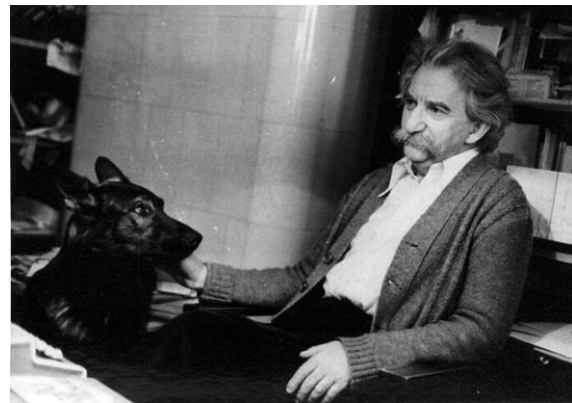
Juri Lotman

Ülikool kokku pannud esindusliku programmi. Muu hulgas toimub 2022. aastal rahvusvaheline konverents „Juri Lotmani semiosfäär“, näitus „Juri Lotman 100“, mida esitletakse mitmes Euroopa linnas, digipärandi projekti „Digitaalset Lotman“ raames esitletakse uut digitaalset arhiivi ja veebipõhist õppekeskkonda.